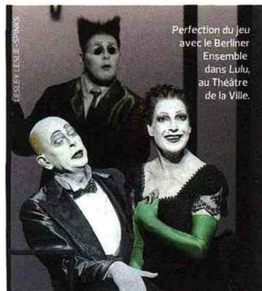
Perfection du jeu avec le Berliner Ensemble dans Lulu , au Théâtre de la Ville.