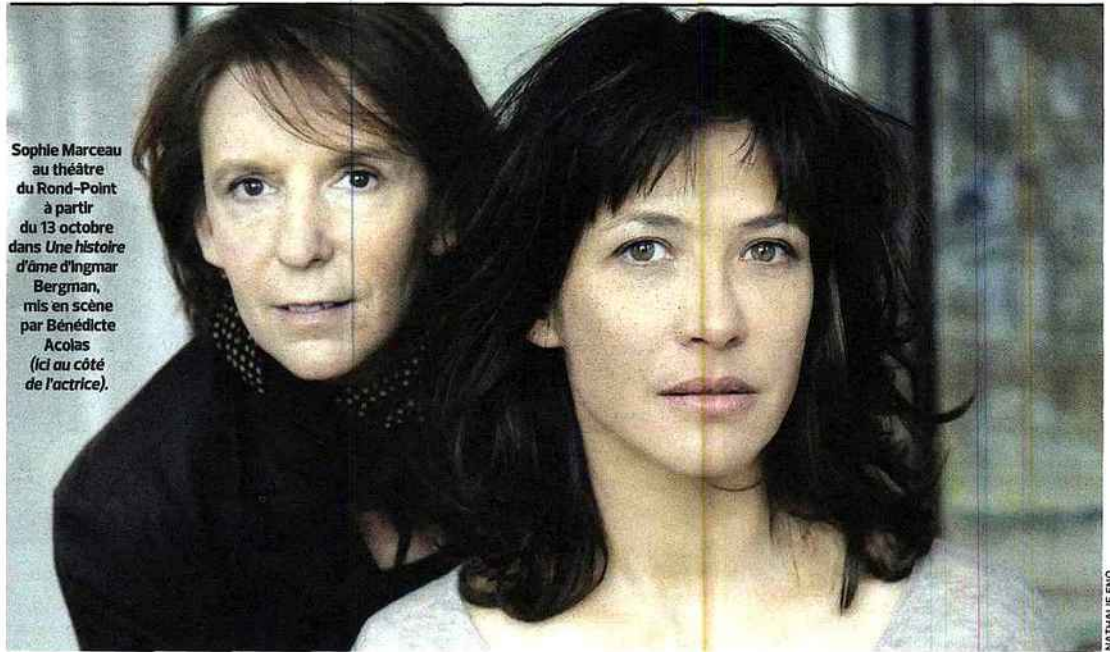
Sophie Marceau au théâtre du Rond-Point à partir du 13 octobre dans Une histoire d'âme d'Ingmar Bergman, mis en scène par Bénédicte Acolas (ici au côté de l'actrice).

SEMAINE DU MERCREDI 7 AU 13 SEPTEMBRE 2011