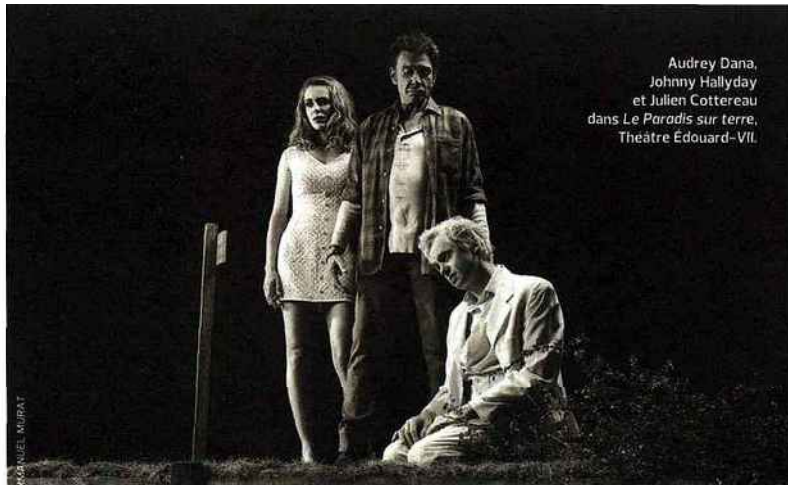
Audrey Dana, Johnny Hallyday et Julien Cottereau dans Le Paradis sur terre , Théâtre Édouard-VII.