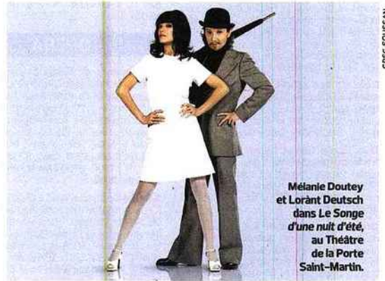
Mélanie Doutey et Lorant Deutsch dans Le Songe d'une nuit d'été , au Théâtre de la Porte Saint-Martin.